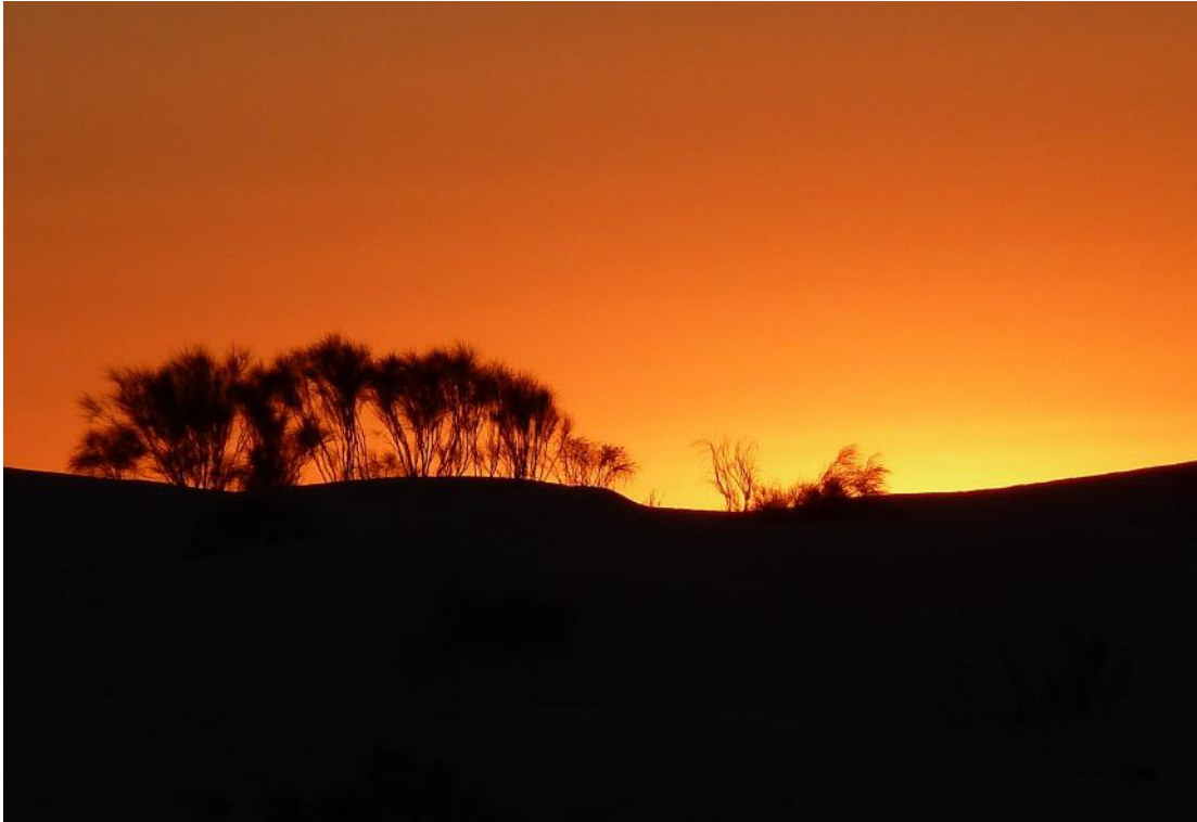
Wüsten-Retreat Ostern 2018